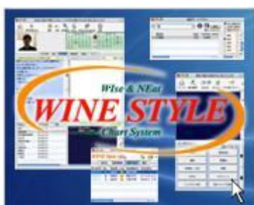
(電子カルテ (WINE STYLE) 画面)

この調査研究事業は、中国での糖尿病診療や患者様への教育指導の向上を目指し、日本の医師・各参加企業とともに、診療・栄養指導・運動指導・電子カルテ等、日本式の糖尿病診療を試験的に導入し、その効果をはかるプロジェクトです。