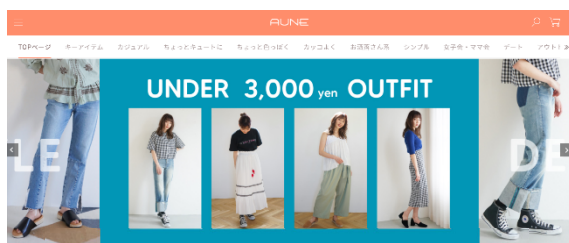
新たにオープンした【ECサイト】

バロック社は、女性向けアパレルブランドを主軸として、MOUSSY、SLYなど17ブランド(この度のセキュリティコンサルティング対象となるECサイトAUNEはそのうち複数のブランドを取り扱う予定)を展開している製造小売り企業です。2020年2月末時点、日本に356店舗、2019年12月末時点、中国に285店舗、その他海外5店舗を保有しており、自社ECサイトを開発、運営しております。一方、CAICAテクノロジーは、世界大手のシステムインテグレーターのコアパートナーとして長年にわたり、インフラ関連全般の設計・導入・運用・保守を行う「基盤インフラ」業務を手掛けて参りました。また、仮想通貨交換所などのセキュリティを担当するなど、昨今、重要度が増しているインターネットセキュリティ業務を積極的に展開しております。